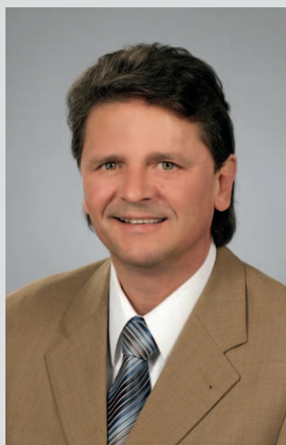
Helmut Haider Erster Bürgermeister der Stadt Vilsbiburg

Nur wenn wir gemeinsam die vielfältigen Möglichkeiten des neuen Stadt-Logos einsetzen, werden wir Vilsbiburgs Charakter stärken und bewahren – zum gegenseitigen Nutzen und für das Image unserer Stadt.